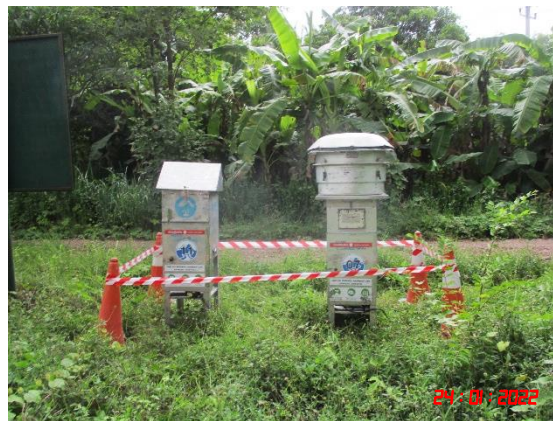
บ้านหนองรีน