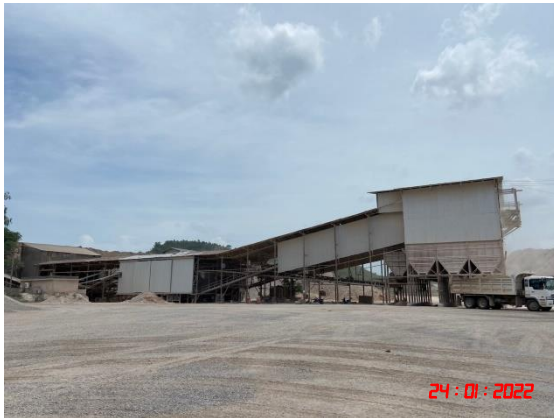
อาคารปิดคลุมโรงโม่หิน