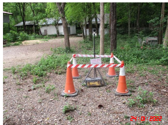
บ้านเขาพระเอก (หลังไถ่ที่สุดท้ายทางด้านทิศตะวันออก)