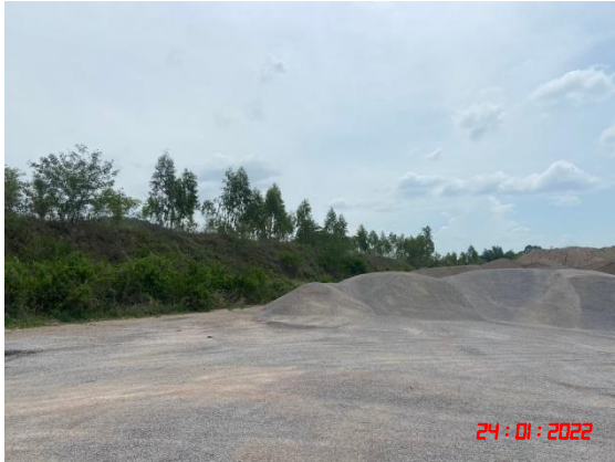
ลานเก็บกองแร่ที่เป็นลานหินบดอัดแน่น