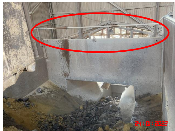
ระบบสเปรย์น้ำ