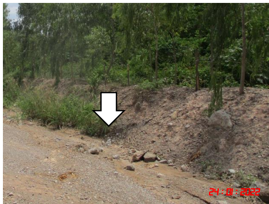
คูระบายน้ำ