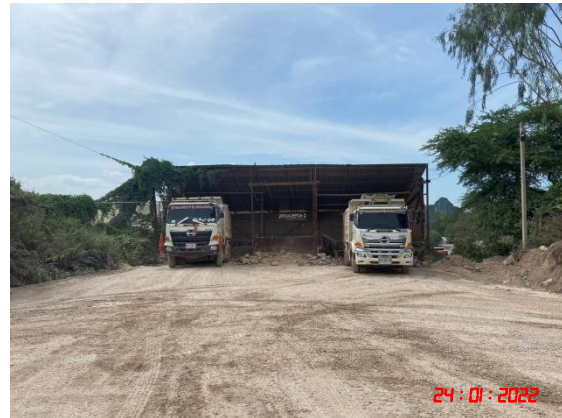
อาคารปิดคลุมย้งรับหินใหญ่