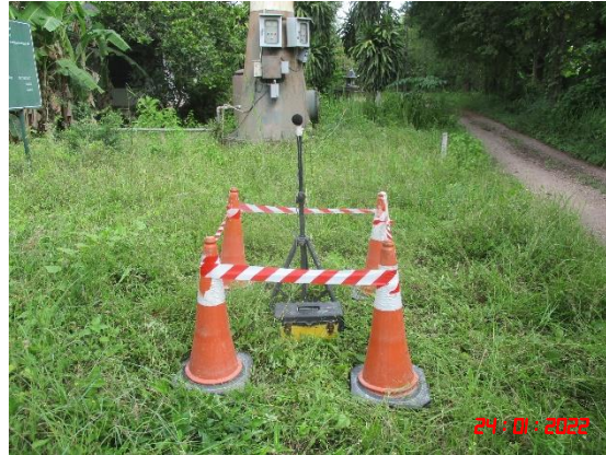
บ้านหนองรีน

รูปที่ 2-28 การตรวจวัดความสั่นสะเทือนขณะระเบิดหน้าเหมือง ในวันที่ 19 มกราคม 2565