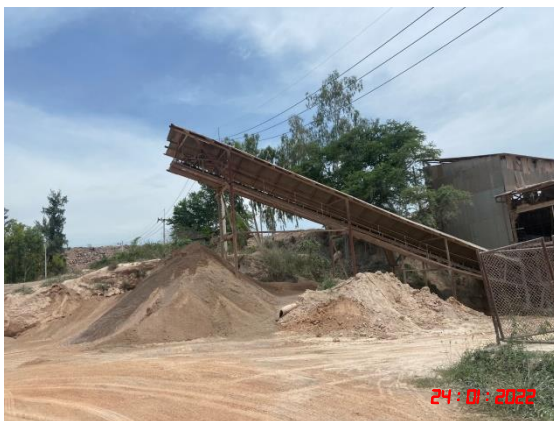
หลังคาปิดคลุมสายพานลำเลียง