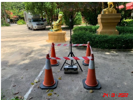
โรงเรียนชุมชนวัดทุ่งหลวง