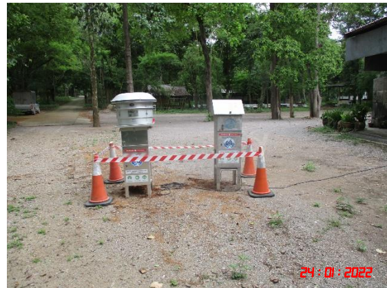
บ้านเขาพระเอก (หลังไถ่ที่สุดท้ายทางด้านทิศตะวันออก)