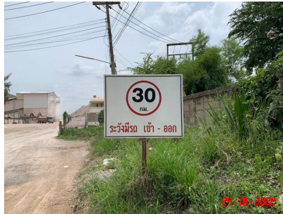
รูปที่ 2-16 ป้ายเตือนความปลอดภัยและนโยบายด้านสิ่งแวดล้อมในพื้นที่ทำงาน