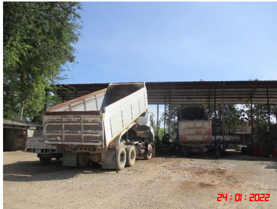
รูปที่ 2-21 จุดขนถ่ายหินกรวดบรรทุก