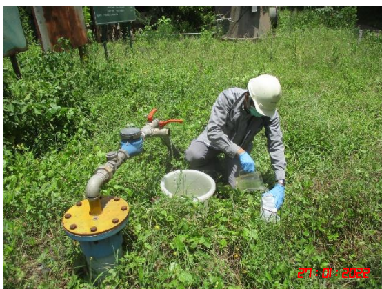
บ่อบาดาลบ้านหนองรีน

รูปที่ 2-29 การเก็บตัวอย่างน้ำใต้ดิน ในวันที่ 27 มกราคม 2565