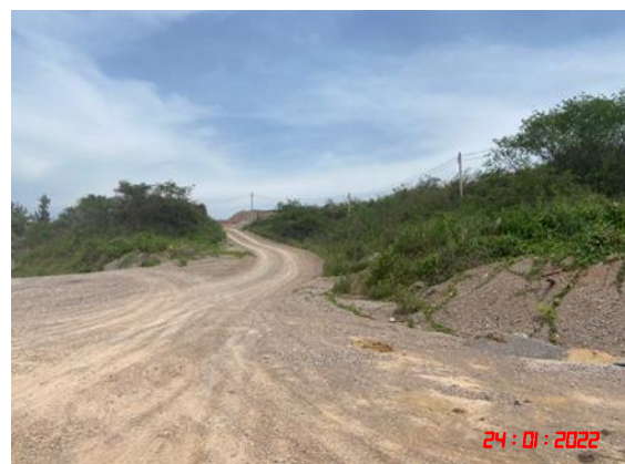
ถนนหินบดอัดแน่นบริเวณโรงโม่หิน