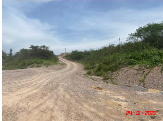
เส้นทางลำเลียงแร่บริเวณโรงโม่หิน