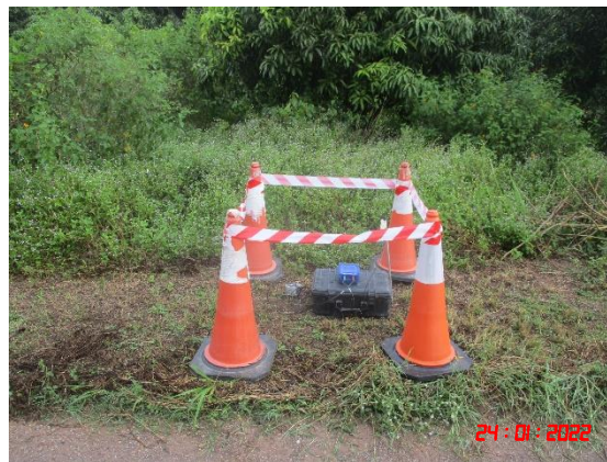
บ้านเขาพระเอก (หลังใกล้ที่สุดทางด้านทิศตะวันออก)

รูปที่ 2-28 การตรวจวัดความสั่นสะเทือนขณะระเบิดหน้าเหมือง ในวันที่ 19 มกราคม 2565