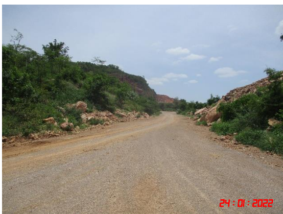
ถนนลูกรังเข้าสู่พื้นที่หน้าเหมือง