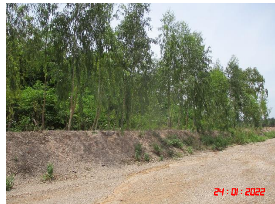
คันทำนบดิน