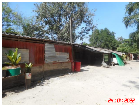
รูปที่ 2-25 ห้องสุขาสำหรับพนักงาน