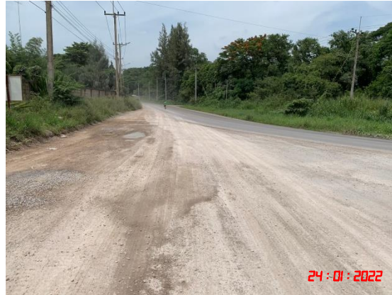
ถนนลาดยางส่วนบุคคลของกลุ่มโรงโม่หิน