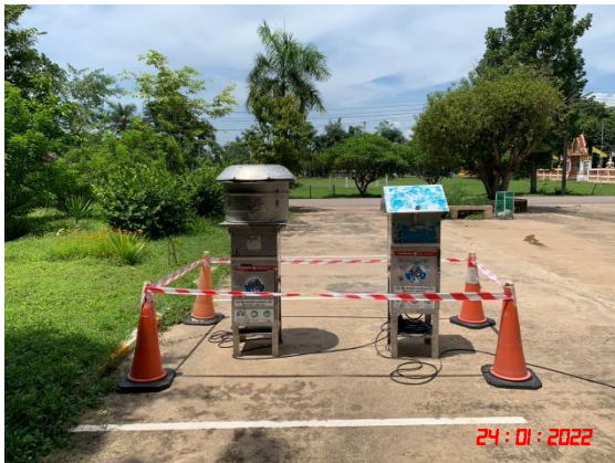
โรงเรียนชุมชนวัดทุ่งหลวง