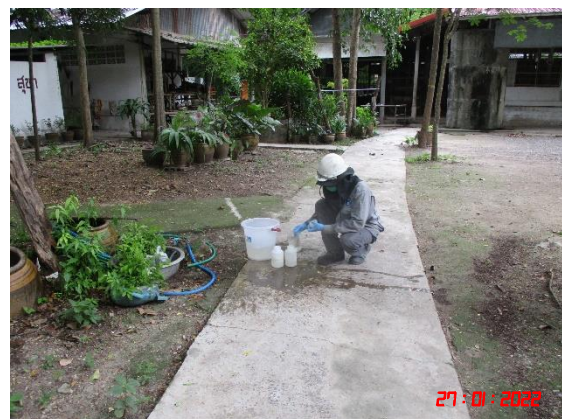
บ่อบาดาลวัดเขาพระเอก